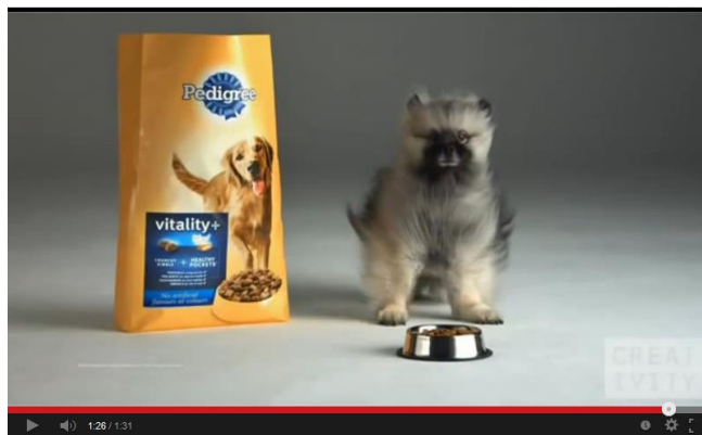
Pedigree Dogs ad shot 1000 FPS using the Phantom camera

http://www.youtube.com/watch?v=mUCRZzhbHH0#t=19