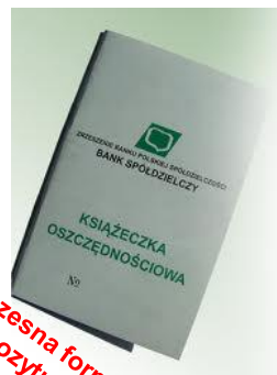
Nowoczesna forma depozytu