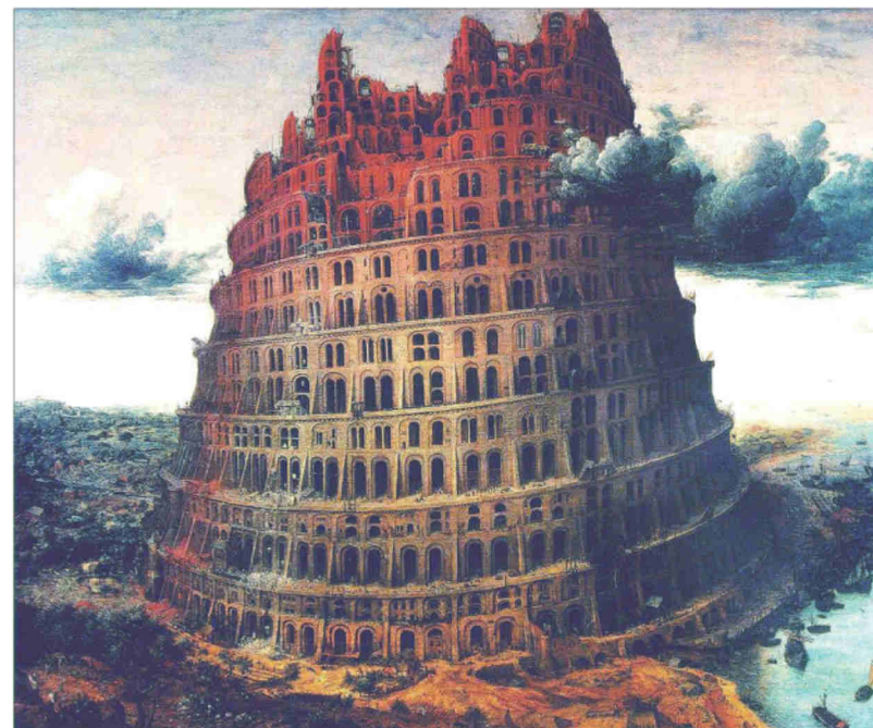
WIEŻA BABEL, BRUEGHEL

„WIEŻA BABEL, PIĘKNY, CHOĆ NIELUDZKI ŁĄD, CORAZ DALEJ, CZY TO POSTĘP, CZY TO BŁĄD, CORAZ DALEJ CORAZ TRUDNIEJ UCIEC STĄD”