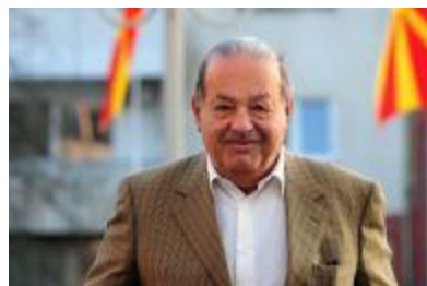
Carlos Slim Helu