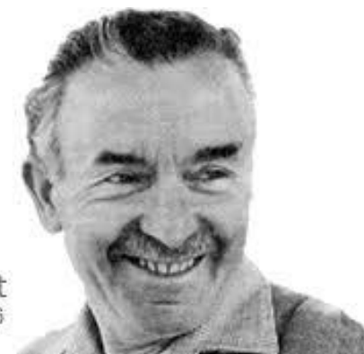
Célestin Freinet 1896 - 1966