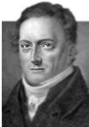
Jan Fryderyk Herbart